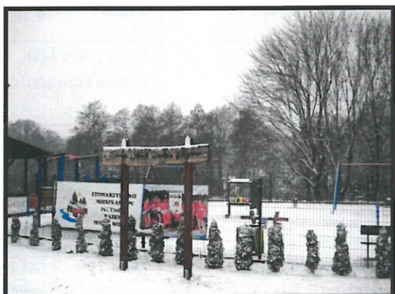
Plac zabaw – miejsce rekreacji