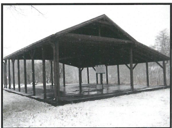
Wiata – miejsce integracji mieszkańców