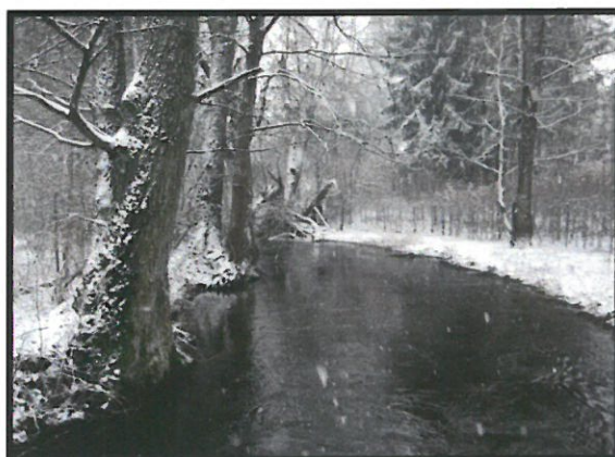
Plitnica – prawy dopływ Gwdy