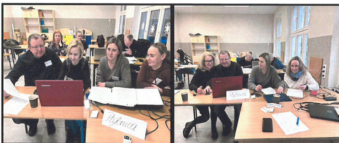
Grupa Odnowy Wsi w czasie warsztatów opracowania Sołeckiej Strategii Rozwoju Zespół Szkół w Tarnówce w dniach 09-10.II.2024 r.

SOLECKA STRATEGIA ROZWOJU – PŁYTNICA wypracowana przez GOW na warsztatach w ramach programu UMWW - „Wielkopolska Odnowa Wsi 2020+”