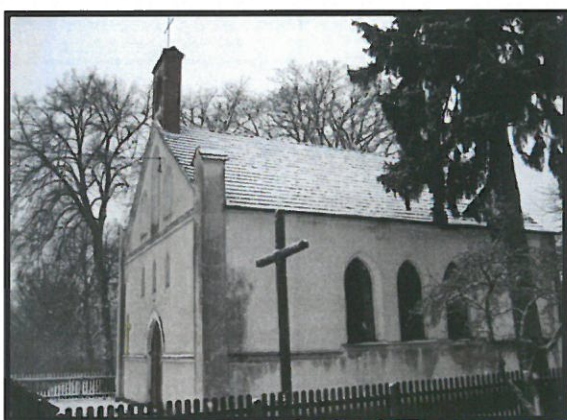
Neogotycki Kościół z 1852 r. pw. Najświętszego Serca Pana Jezusa