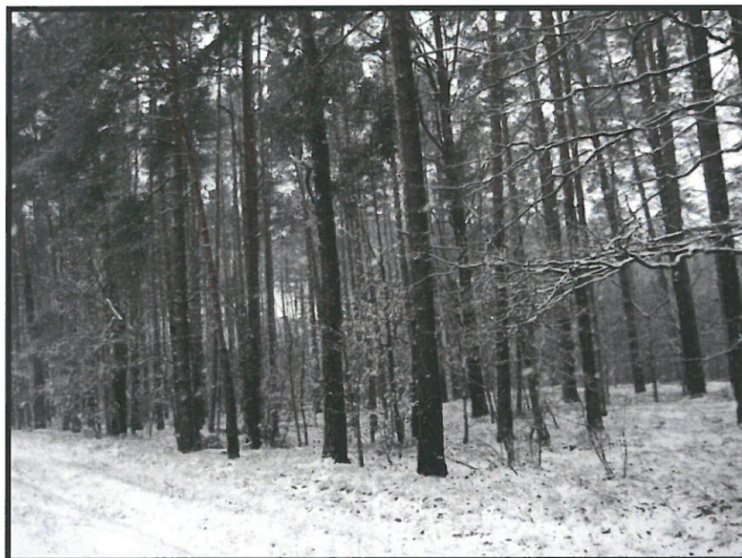
Płytnica i jej tereny leśne