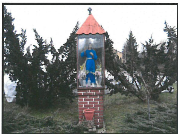
Miejsce kultu religijnego