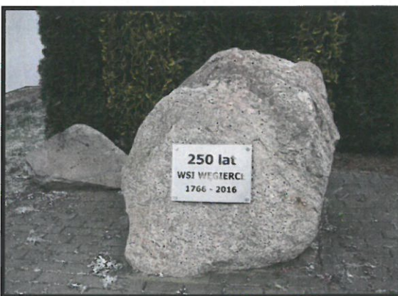
Tablica upamiętniająca powstanie miejscowości