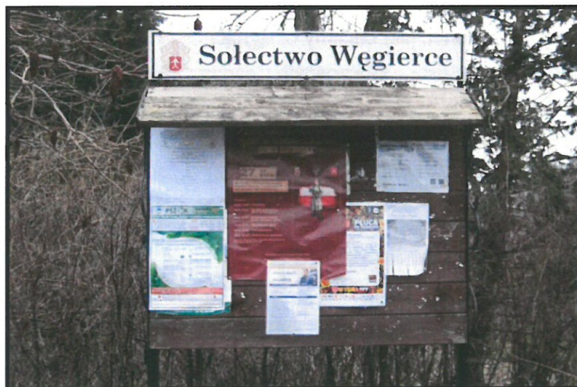
Tablica informacyjna sołectwa