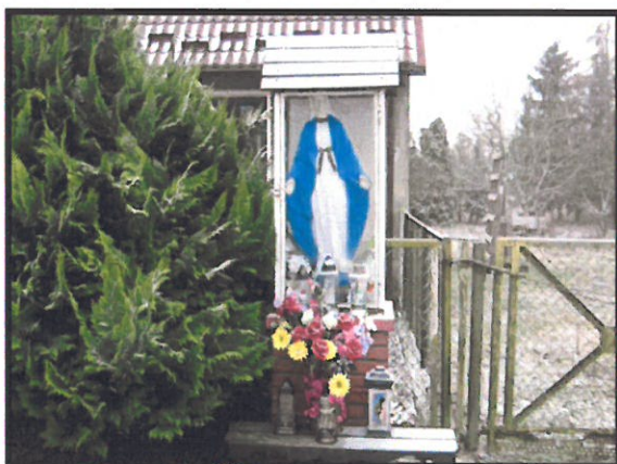
Miejsce kultu religijnego w Pomiarkach