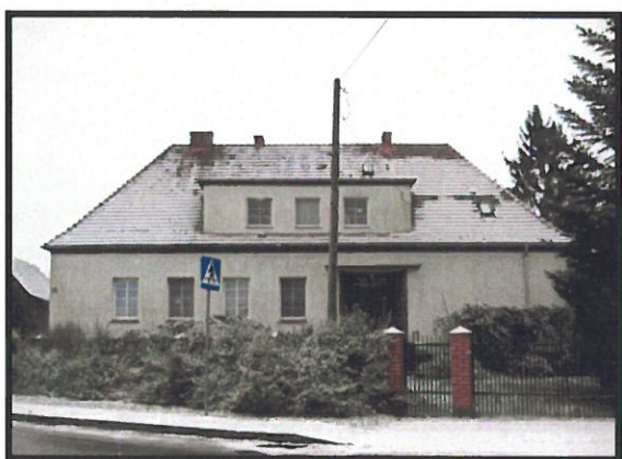
Budynek dawnej szkoły w Węgiercach