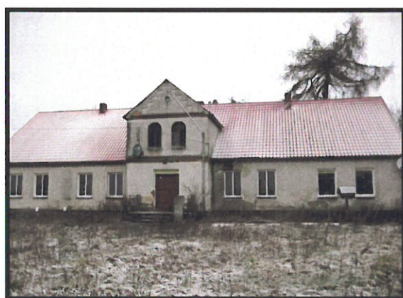
Dwór z XIX w. w Pomiarkach