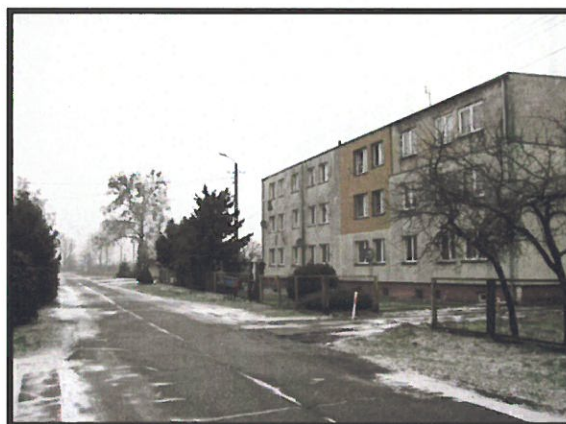
Architektura osady Pomiarki