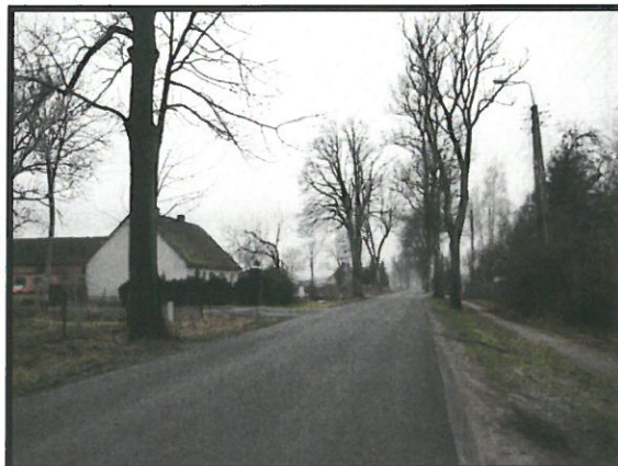
Architektura wsi Węgierce