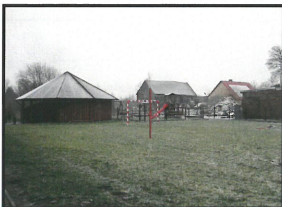
Miejsce integracji i rekreacji mieszkańców