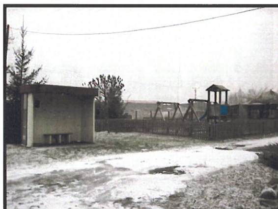
Miejsce spotkań i rekreacji