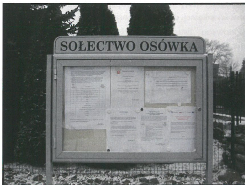
Tablica informacyjna sołectwa