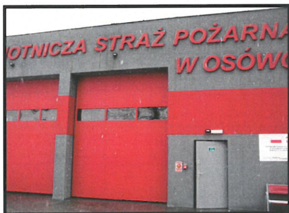
Ochotnicza Straż Pożarna