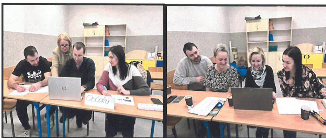
Grupa Odnowy Wsi w czasie warsztatów opracowania Sołeckiej Strategii Rozwoju Zespół Szkół w Tarnówce w dniach 09-10.II.2024 r.

SOLECKA STRATEGIA ROZWOJU – OSÓWKA wypracowana przez GOW na warsztatach w ramach programu UMWW - „Wielkopolska Odnowa Wsi 2020+”