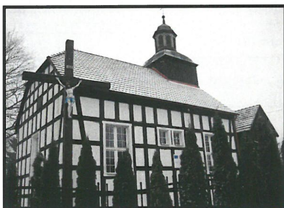
Kościół pw. Świętej Rodziny