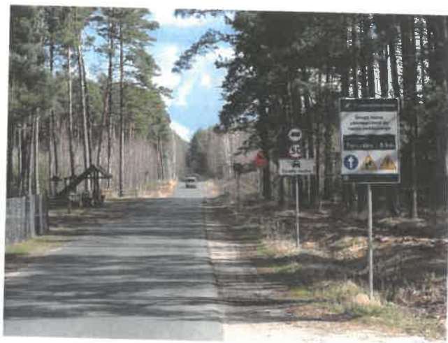
Zdjęcie 2 Droga dojazdowa do miejscowości

Opracowanie Sołeckiej Strategii Rozwoju było skutkiem przeprowadzenia dwudniowych warsztatów , które poprzedzone zostały wizytacją miejscowości przez moderatorów.