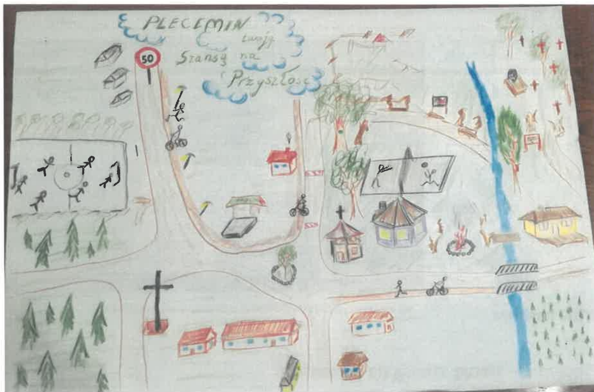
Zdjęcie 21 Wizja obrazkowa miejscowości wykonana podczas warsztatów przez Przedstawicieli GOW