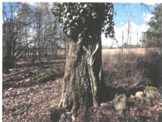
Zdjęcie 15 Roślinność na cmentarzu