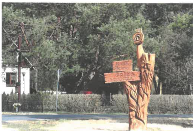
Zdjęcie 5 Unikatowy drewniany witacz w miejscowości

Aktualnie Plecemin to wieś rekreacyjno-wypoczynkowa, której większość mieszkańców, poprzez pracę i naukę, związana jest ze znajdującą się w odległości 15 kilometrów Piłą. Wieś dynamicznie się rozwija, wykorzystując w sposób planowy, swoje naturalne zasoby. Las, rzeka Gwda, łąki, cisza i przygotowane do rekreacji zaplecze, przyciąga nowych mieszkańców. W obrębie wsi jest zlokalizowanych ponad dwieście działek, przeznaczonych pod budownictwo mieszkalne i rekreacyjne. Doprowadzony jest światłowod. W odległości dwóch kilometrów przebiega trasa nr 11, łącząca Poznań z wybrzeżem.