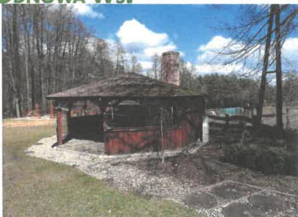
Zdjęcie 8 wiaty rekreacyjna – miejsce spotkań mieszkańców