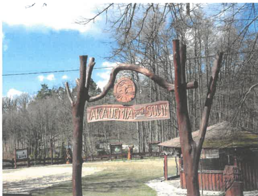
Zdjęcie 7 Wejście na teren Akademii prof. Sowy

Wieś Plecemin nadal będzie się intensywnie rozwijać. W planach jest budowa świetlicy wiejskiej, rozbudowa wodociągu, poprawa funkcji komunikacyjnych wsi. Społeczność się integruje i hasło strategii rozwoju sołectwa na kolejne lata - „Plecemin – twoją szansą na przyszłość , już nabiera realnych kształtów.