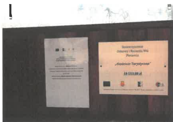
Zdjęcie 11 Tablice informacyjne o projektach zrealizowanych przy dofinansowaniu zewnętrznym