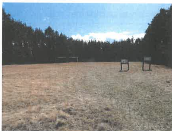
Zdjęcie 19 Boisko sportowe