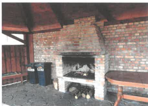
Zdjęcie 12 Kominek – miejsce wspólnego grillowania