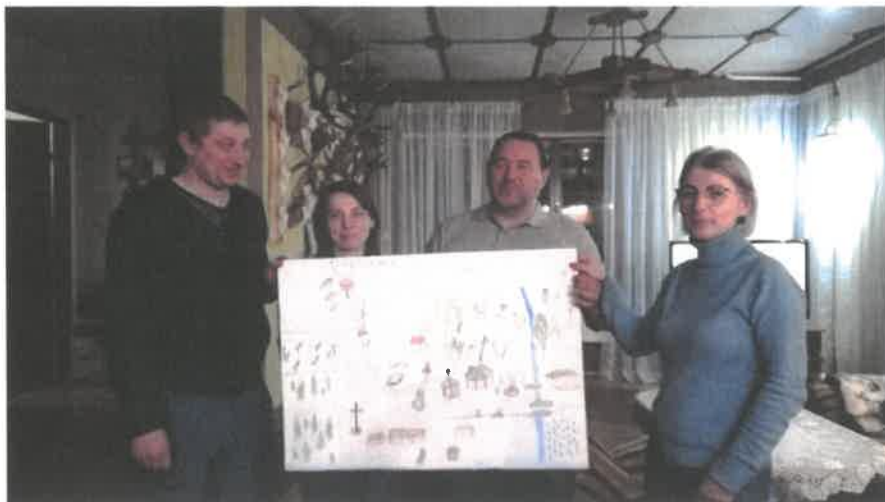
Zdjęcie 20 Prezentacja wizji obrazkowej miejscowości