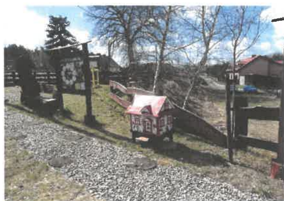
Zdjęcie 10 Elementy ścieżki edukacyjnej, ul pogłdowy