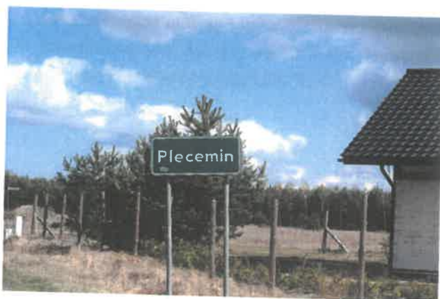
Zdjęcie 1 Wjazd do miejscowości Plecemin