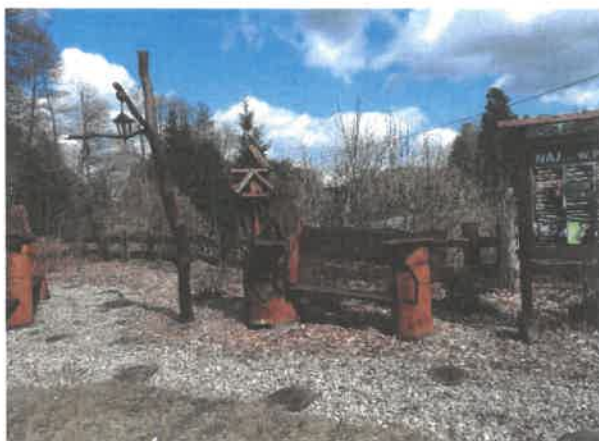
Zdjęcie 9 Tablice edukacyjne, miejsce rekreacji z charakterystycznymi drewnianymi rzeźbami