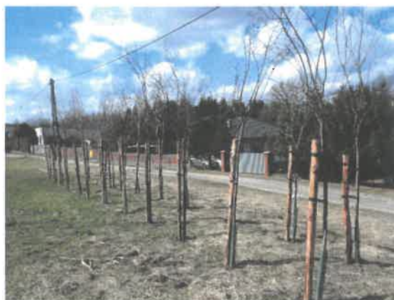
Zdjęcie 13 Nasadzenia wykonane w czynie społecznym