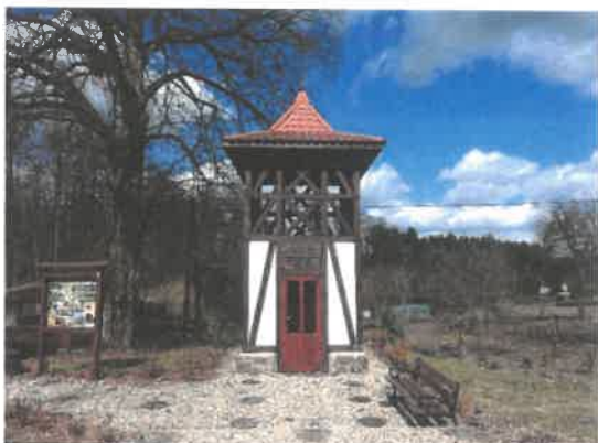
Zdjęcie 16 Dzwonnica odrestaurowana przez mieszkańców z kapliczką wewnątrz