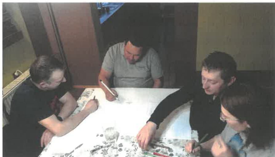
Zdjęcie 22 Praca nad stworzeniem wizji obrazkowej miejscowości