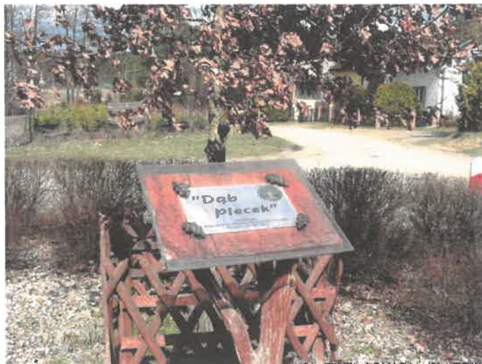
Zdjęcie 6 Przejaw aktywności sołectwa – tablica upamiętniająca dąb – z nowym nasadzeniem

Zdecydowana większość realizowanych w Pleceminie przedsięwzięć społecznych o charakterze integracyjno-sportowym, jest prowadzona na terenie Akademii Profesora Sowy. Jest to obiekt ulokowany w centrum wsi, na działce będącej w zarządzie lokalnego stowarzyszenia, zbudowany ze środków samorządowych gminy i województwa, w zdecydowanej większości, rękami mieszkańców. Akademia to wiata integracyjno-edukacyjna z zapleczem socjalnym, profesjonalna ścieżka edukacyjna, plac zabaw, boisko do siatkówki i miejsce na ognisko. Akademia Profesora Sowy jest wizytówką Plecemina.