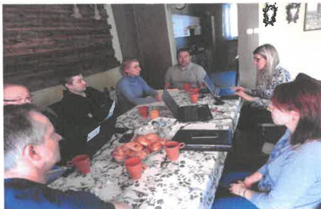
Zdjęcie 3 Pierwsze warsztaty pisania SSR – kwiecień 2022

Drugiego dnia warsztatów mieszkańcy zobowiązani byli wskazać, na podstawie przeprowadzonych wcześniejszych analiz w poszczególnych obszarach rozwojowych sołectwa, planowane zamierzenia projektowe. Tak powstał plan długo i krótkoterminowy rozwoju sołectwa Plecemin na najbliższy rok i 5-lat. W planie krótkoterminowym wskazano te projekty/zadania, które mieszkańcy sołectwa planują zrealizować w pierwszej kolejności – w okresie 12 miesięcy. Następnie w ramach planu długoterminowego zaplanowano zadania na lata przyszłe. W planie długoterminowym wskazano cele jakie sołectwo określiło dla realizacji Wizji Rozwoju Sołectwa . Cele zostały postawione w poszczególnych obszarach interwencji, które Grupa Odnowy Wsi postanowiła osiągnąć poprzez realizację zadań i projektów zapisanych w planie długoterminowym i programie krótkoterminowym.