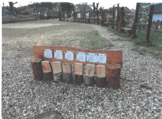
Zdjęcie 17 ławeczka edukacyjna – gatunki drzew