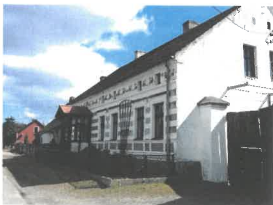
Zdjęcie 18 Fasada zabytkowego budynku