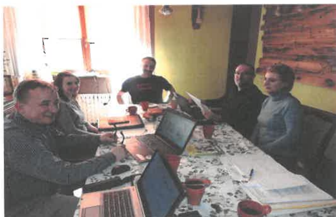
Zdjęcie 4 Drugie warsztaty pisania SSR – kwiecień 2022

Przedstawiciele Grupy odnowy wsi wykonali również graficzną wizję miejscowości . Strategia Rozwoju Sołectwa Plecemin została poddana publicznej konsultacji, a następnie przyjęta przez zebranie wiejskie – w formie uchwały zebrania wiejskiego.