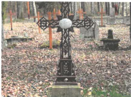
Zdjęcie 14 Zabytkowy cmentarz ewangelicki