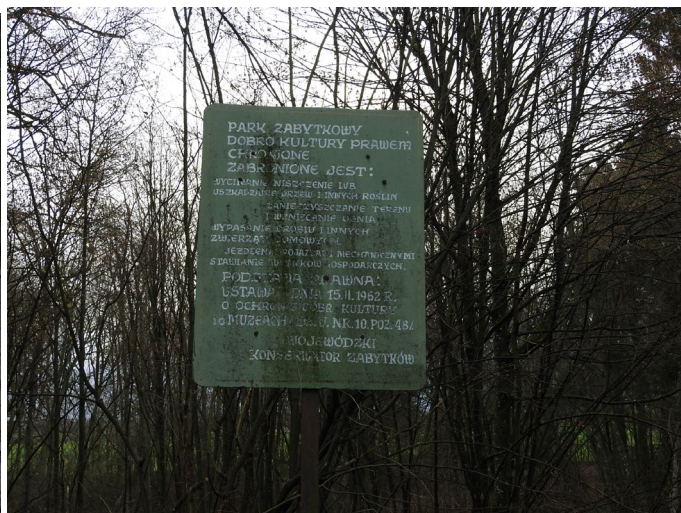
Pałac dworski z początku XIX wieku, mieszkania socjalne, Park zabytkowy wokół pałacu, obszar 6ha